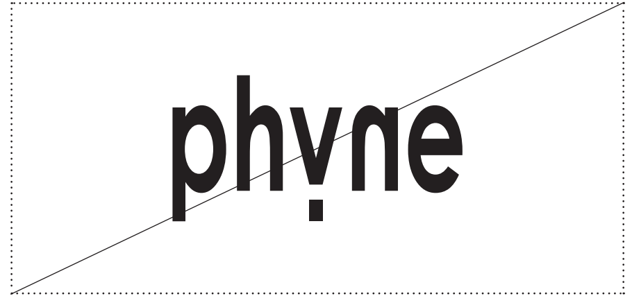
Il est interdit de déformer le logo.