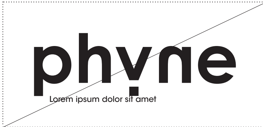
Il est interdit d'empiéter sur la zone de protection.